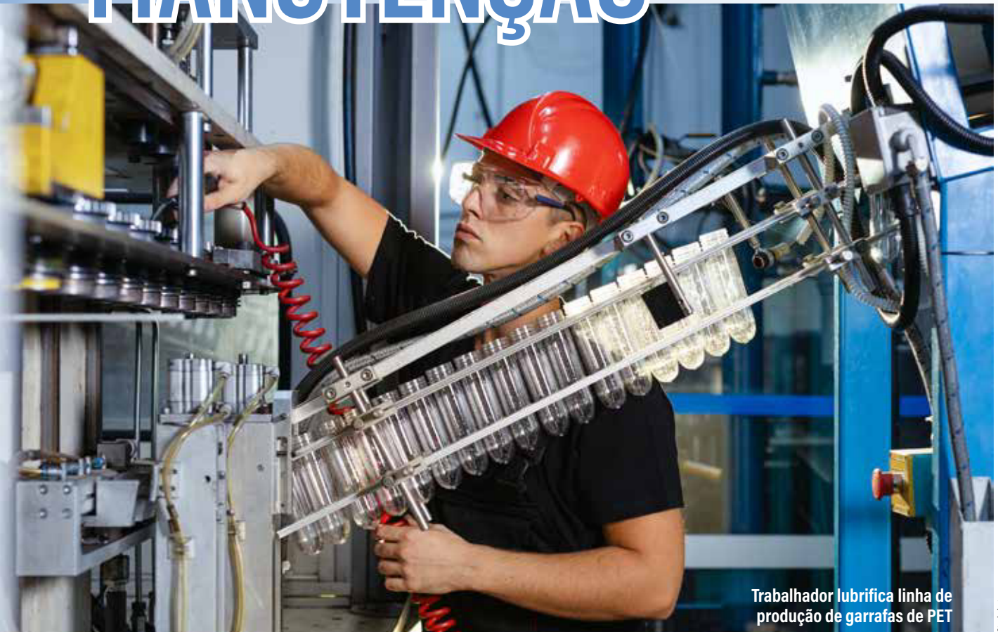
Trabalhador lubrifica linha de produção de garrafas de PET